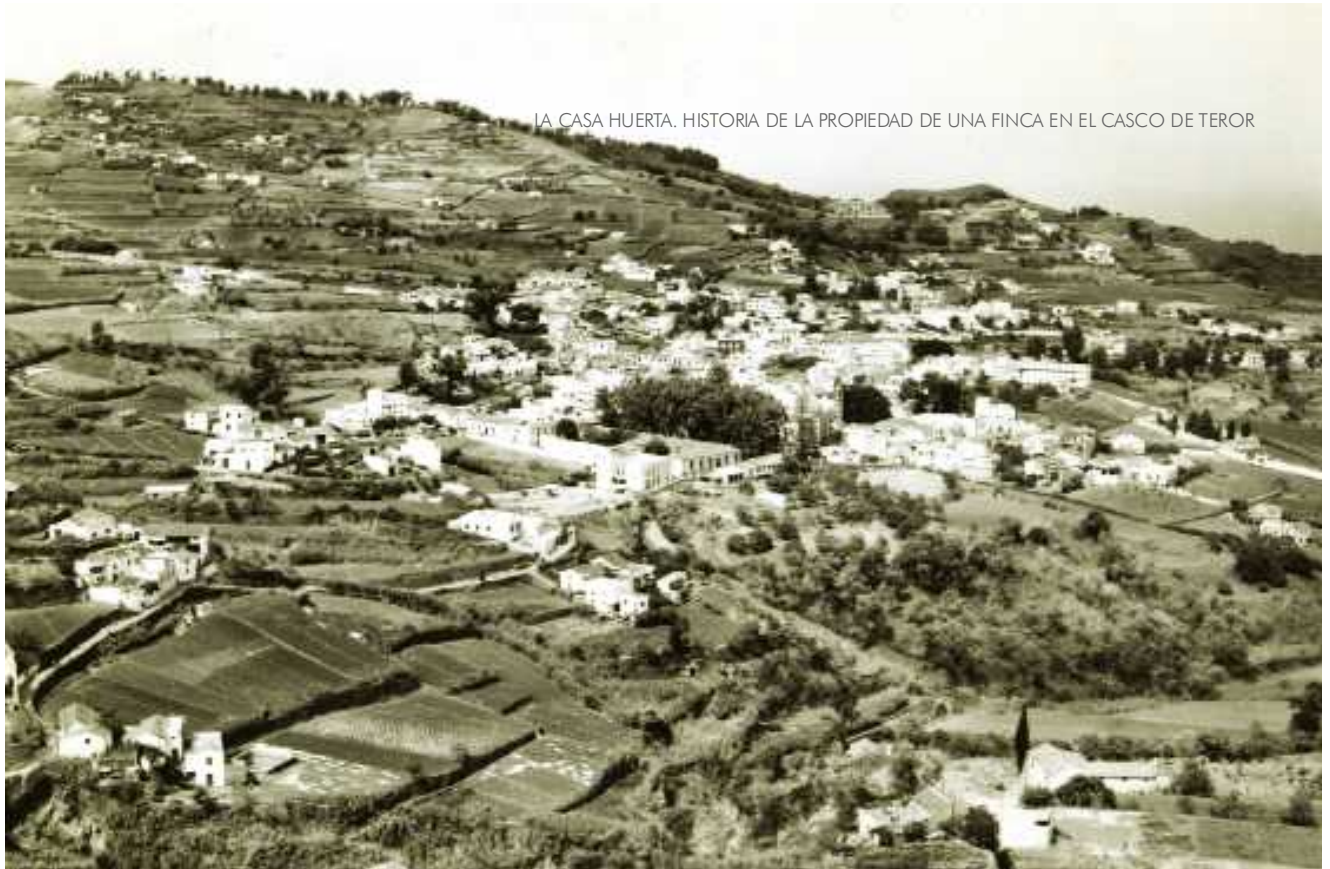
LA CASA HUERTA. HISTORIA DE LA PROPIEDAD DE UNA FINCA EN EL CASCO DE TEROR