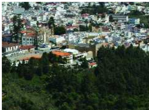
Imágenes de la Finca en la década de los 70 y actualmente