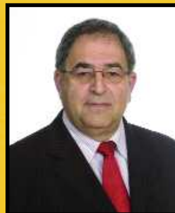
Juan de Dios Ramos Quintana Alcalde de Teror