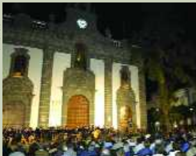
El Pórtico de la Basílica acoge desde hace varios años el Pregón de la Fiesta del Pino.

Ser pregonero de Teror y de la Virgen del Pino, pregonar la fiesta mayor de Gran Canaria, no sólo supone un honor sino comporta un prestigio.