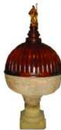
La antigua pila bautismal de la Basílica del Pino es uno de los objetos citados en 1558 en el Libro de Fábrica de la Parroquia de Teror, mandado a escribir por el Obispo Deza.

Prosiguió la visita con el inventario de los objetos litúrgicos y la indumentaria religiosa, entre los cuales había cruces, portapaces, manteles, estolas, manípulos, casullas, sobrepellices, misales, andas, bancos y candelabros - entre un largo etcétera - si bien se encontraban en su gran mayoría viejos, rotos o defectuosos, lo que nos da una idea de lo difíciles y modestos que fueron los inicios del culto a la Imagen de Ntra. Sra. del Pino, aspecto que ya se encargó de poner de relieve el sacerdote José García Ortega en su libro titulado "Historia del culto a la venerada imagen de Nuestra Señora del Pino. Patrona de la Diócesis de Canarias" (1936). Lamentablemente, la incuria de los tiempos - o quizá la de los hombres - nos ha privado de poder seguir contando con piezas tan valiosas como el paño de Flandes en el que figuraban Jesús crucificado, la Virgen, San Juan, la Magdalena y otras muchas imágenes; o el retablo "viejo" en el que aparecía pintada "Nuestra Señora". Afortunadamente, no ha sido este el caso de la pila de "bautizar de cantería colora-