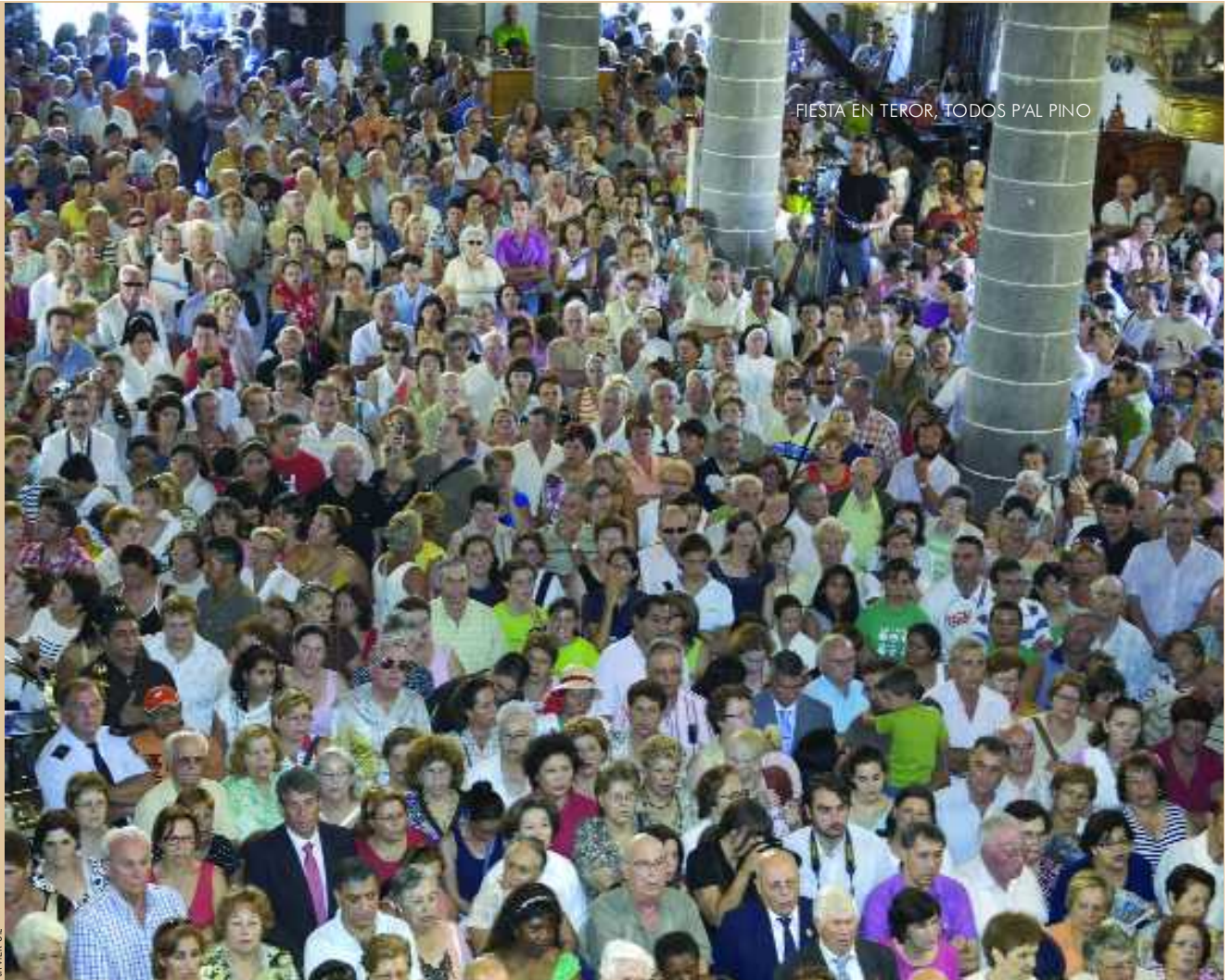
Una gran multitud llena cada año la Basílica de Teror en la celebración de la Solemne Eucaristía del Día del Pino, el 8 de septiembre.