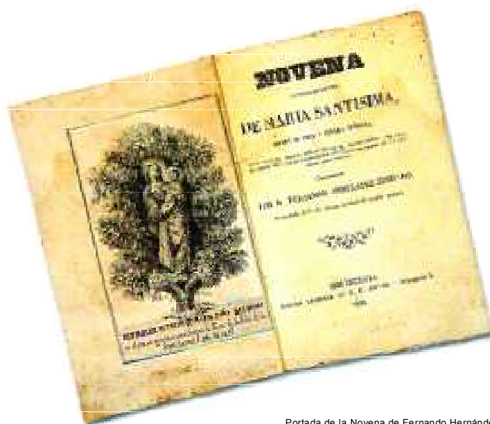
Portada de la Novena de Fernando Hernández Zumbado en una edición de 1859.

No es hasta un siglo después cuando aparecen las primeras novenas dedicadas a las dos patronas de Canarias. La primera de ellas, en honor a la Virgen de Candelaria, fue publicada por primera vez en Cádiz en 1750 y cinco años después en Santa Cruz de Tenerife se imprimió la consagrada a la Virgen del Pino, si bien autores como Fray José de Sosa en el siglo XVII y Fray Diego Henríquez en el primer tercio del siglo