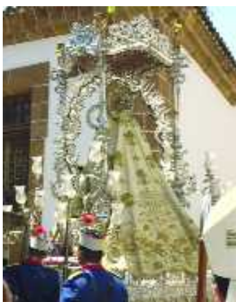
En la página siguiente, la Imagen del Pino con el último manto estrenado en el año 2002.