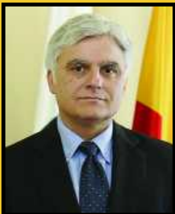
José Miguel Pérez Presidente del Cabildo de Gran Canaria

Las celebraciones de este septiembre provocarán de nuevo el encuentro de toda la isla. Los que ya no están con nosotros no estarán sin embargo ausentes. Los llevaremos entre todos, en cada corazón y en cada paso hacia Teror. Un andar solidario que nos acercará de nuevo al auténtico destino.