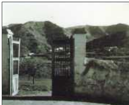
Antigua entrada de la Finca Casa Huerta